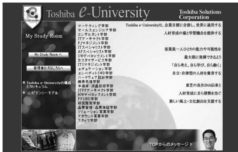
図1 企業内大学と専門職制度

習を進めるには、eラーニングが効果的だ。同社では、年間3回または4回に分けてeラーニングの講座を開催し、月末を挟む約3週間の受講期間を設けることで、客先常駐者などでも学習しやすいタイミングを設定している。