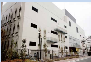
東京第2データセンター

最先端の設備、高密度化したIT機器を備えたクラウドデータセンターでITリソースを提供しますので安心・安全かつ低コストでお使いいただけます。