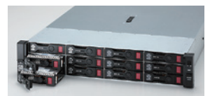
前面に12台、背面/内部に7台の3.5型ドライブを搭載可能(12×3.5型ドライブモデル)