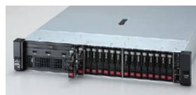
標準8台、最大24台の2.5型ドライブを搭載可能(8×2.5型ドライブモデル)