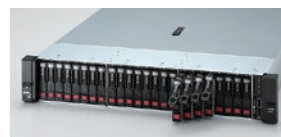
前面に24台、背面に6台の2.5型ドライブを搭載可能(24×2.5型ドライブモデル)